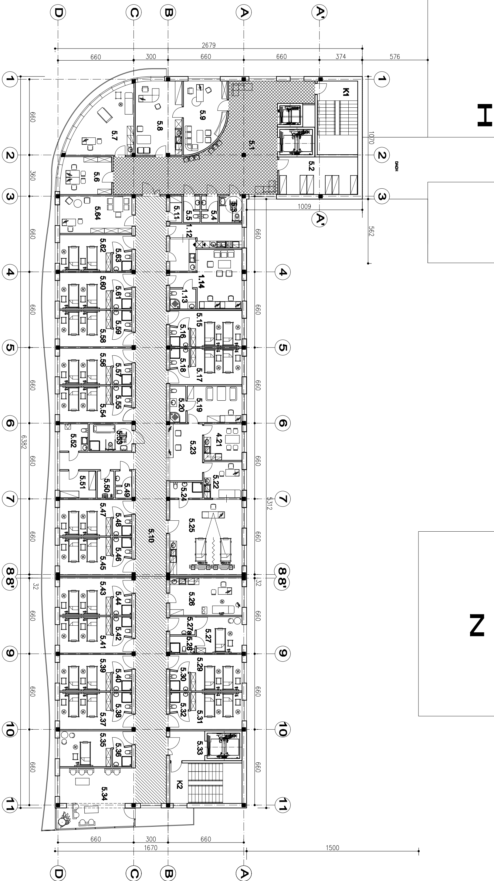
ODDZIAŁ ŁÓŻKOWY - 34 ŁÓŻKA